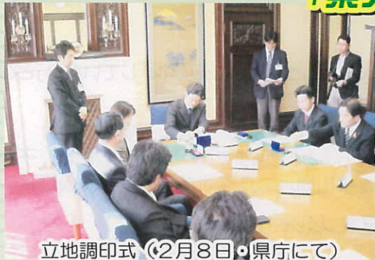
立地調印式 (2月8日、県庁にて)

私が勤務していた、楽天トラベルのコールセンター業務を請け負っている株式会社DIOジャパン様が都城市のITビル(旧寿屋)に進出することになりました。