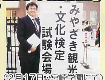
(2月17日、宮崎学園にて)

県議会議員としては唯一、自ら受験しました。いくつかひっかけ問題もありましたが、無事合格しました!