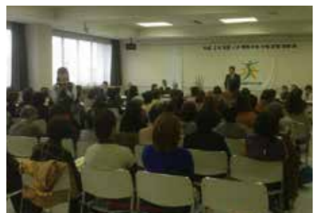
JA宮崎中央女性部通常総会

毎週宮崎に帰っております。初公務は東九州自動車道高鍋～都農間の開通式でした。県や市町村関係の公務に加え、農業関係者をはじめとする多くの皆さんとの意見交換会、牛のセリ市、また春神楽などで地域にお邪魔したりと1区内を走り回っております。お見かけになった際はお気軽にお声かけください!