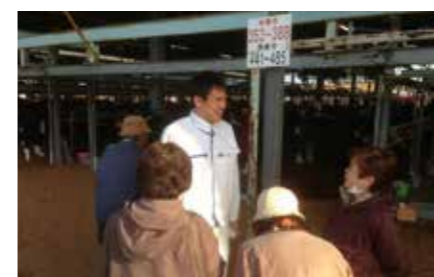
子牛セリ市の視察(2013年2月)

今後は農業者の皆さんが些かも不安を感じられることがないように、また情報提供も含め、与党の一員として誠実に臨んで参ります。