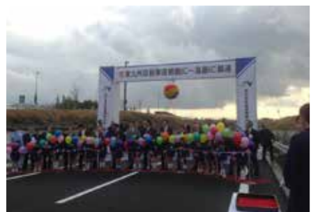
東九州自動車道 高鍋～都農間の開通式