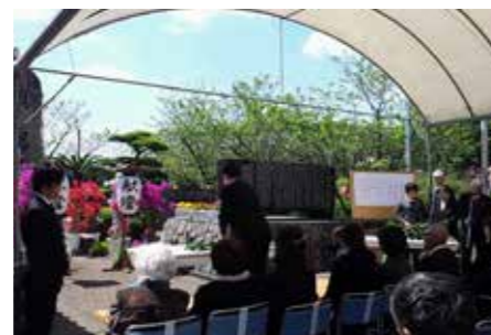
宮崎特攻基地慰霊祭