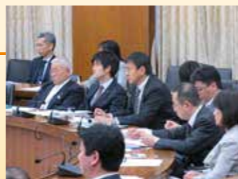
農林水産常任委員会

国会では部会という与党としての自民党の意思決定を行う会議や党派を超えて特定の問題の解決や業界の振興を図る議連などの活動が数多くあり、基本的に毎朝8時には自民党本部にいます。取り組むべき分野は多岐にわたりますが、毎日精力的に取り組んでいます。