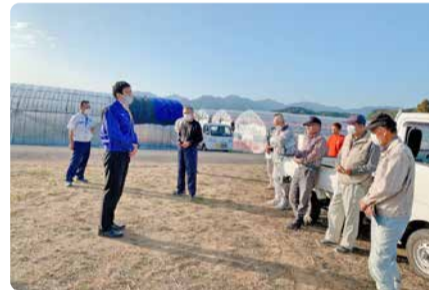
国富町田尻地区での道ばた談義

毎週末できる限り地元に戻り、“3密”を避けてミニ集会・道ばた談義を各地で開催しています。引き続き現場主義を貫き、徹底的に足を運び議論を深めます。