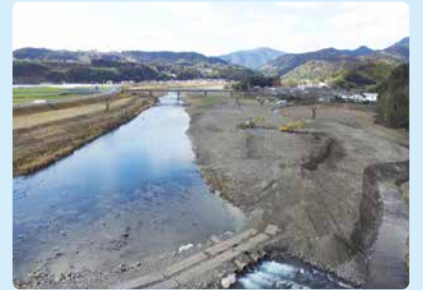
※②綾北川の河道掘削 (国富町太田原地区)