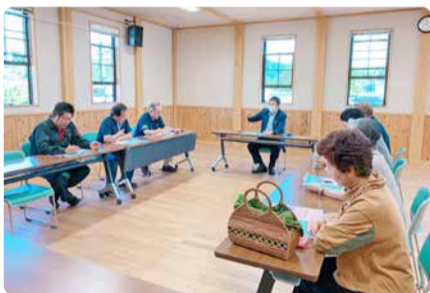
綾町商工会での意見交換会