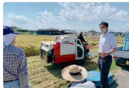
国富町三名地区での道ばた談義