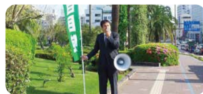
岩切章太郎像前にて