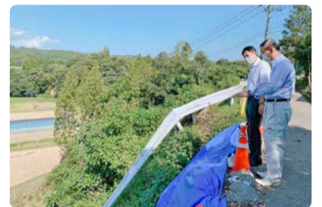
豪雨で被害を受けた現場視察(国富町飯盛地区)