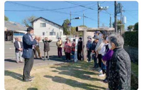
綾町にて道ばた談義