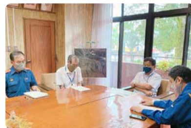
綾町 初田町長と意見交換会