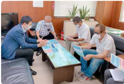
国富町商工会での意見交換会

新型コロナウイルスで影響を受けている事業者の方々と意見交換会を実施しています。さまざまな意見を受けて、国会で制度設計や予算に反映させるべく取り組みます。