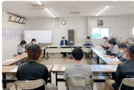
JA綾町青年部と意見交換会