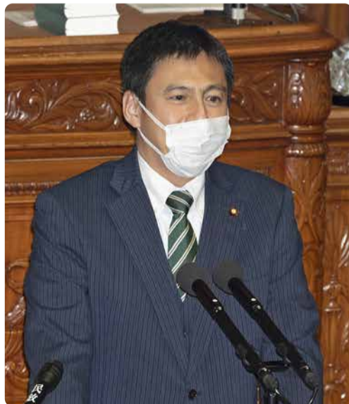
衆議院本会議場の壇上で質問

新型コロナウイルス感染症が拡がる中、時短営業やそれに伴う協力金の支払いなどへの対応を支援する“新型コロナウイルス感染症対応地方創生臨時交付金”。武井俊輔議員は、宮崎県民の「命」と「暮らし」を守り抜くために、予算獲得に向けて数々の実績を上げてきました。宮崎県においては、県全体で約260億円交付したものに、国富町、綾町においても、大規模な予算配分を行いました。