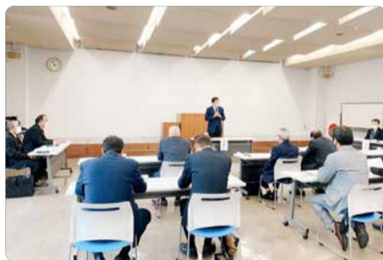
東諸地区・宮崎地区建設業協会と合同で意見交換会