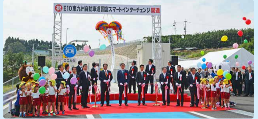
※③東九州自動車道 国富スマートインターチェンジ開通式