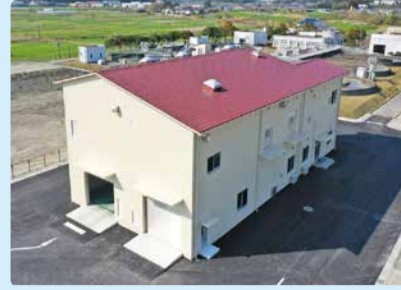
※①国富町浄化センター内 前処理施設整備を実現 (国富町太田原地区)

地域経済や防災の観点としても重要な機能を果たす東九州自動車道。令和元年10月に、国富スマートインターチェンジが開通。令和2年12月には、宮崎西～清武4車線化整備に向けて着工式が開かれました。延岡まで4車線化早期実現に向けて取り組みます。また、国道10号線住吉道路(新名爪～佐土原町)についても、事業採択に向けての環境影響評価へ着手が決まり新規事業として採択される見通しです。※③