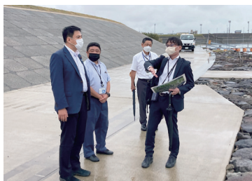
八重川津波高潮対策事業視察