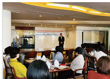
自民党宮崎市支部女性局ランチセミナー