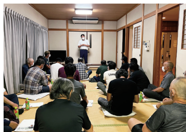
檣地区意見交換会