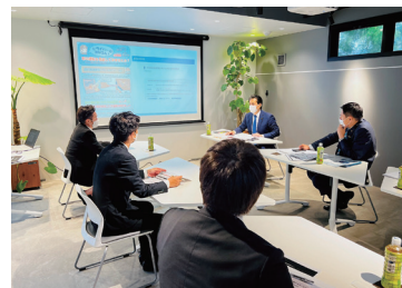
中小企業視察・意見交換会