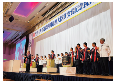
全共4大会連続内閣総理大臣賞受賞祝賀会